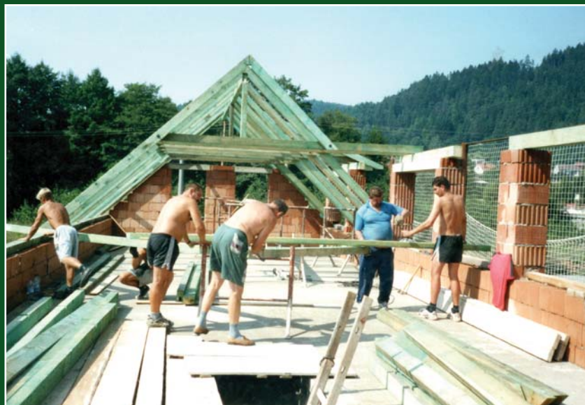
Srpen 2002 – montáž vazby byla hotova za jednu sobotu