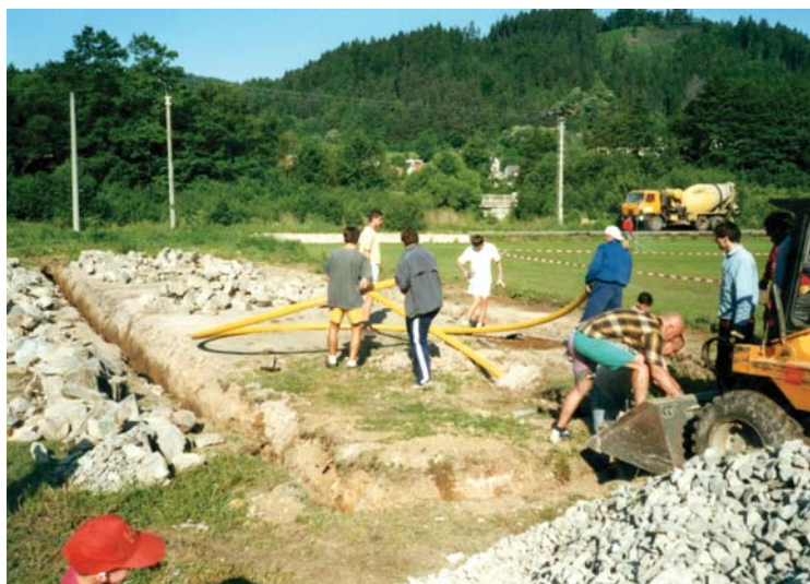
8. 6. 2002 – betonujeme základy