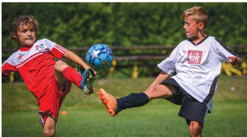
Ve všech utkáních se urputně bojovalo o každý míč