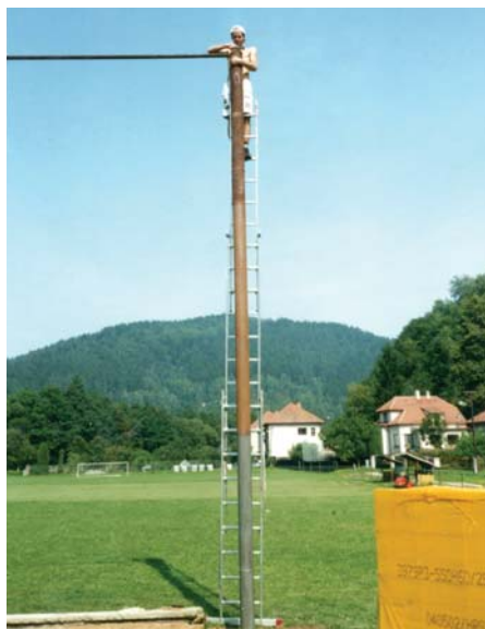
Červenec 2002 – příprava konstrukce na zavěšení ochranné sítě probíhala souběžně se stavbou kabin – Petr Pokorný ml. se práce ve výšce nebál