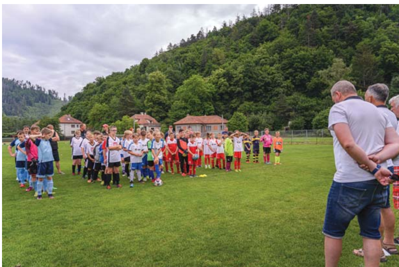
Turnaj byl zahájen nástupem všech účastníků